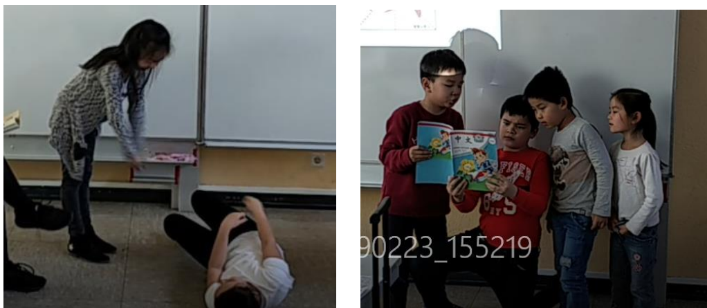
配图: 有趣的课堂活动

寓教于乐一直是中文学校多年的坚持的教学理念。中文班的游戏环节更是让大家花了很多心思。将字卡分发给学生，请他们拿着字卡站在前面，对于年纪小的孩子，可以让她们做一些，类似“A字跳，A字跳，A字跳完B字跳”的游戏，但是对于年纪比较大的孩子他们可能就会对此不屑一顾，所以我们年纪比较大的孩子对游戏的规则进行改动，例如“A字可以要求某人做一个奇怪的动作”。这样既活跃了气氛，又加强了语言的使用机会，孩子们乐此不疲。同样，我们也会经常做一些分组的游戏，将不同年龄的孩子分成一组完成某项任务，这样的互助既弥补了孩子年龄差距带来的问题，更加强了班级内孩子们的感情，同时给了孩子们更多的语言交流的机会。