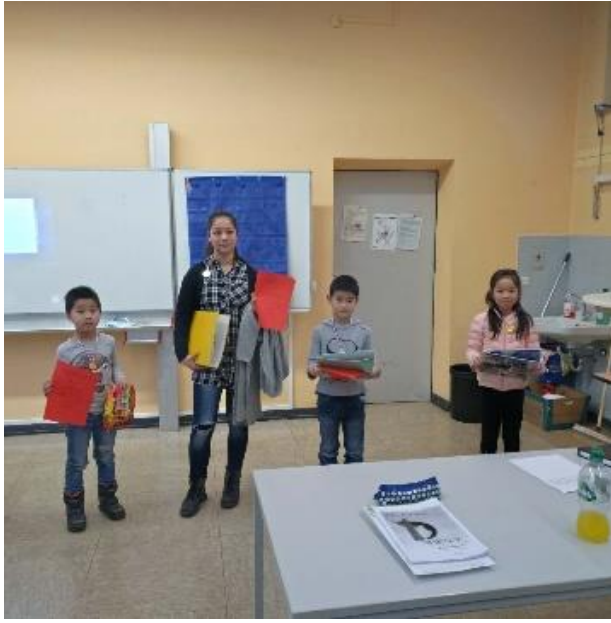
配图: 亲子阅读比赛获奖前三名